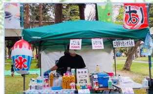
三陸夢を稔らせる会