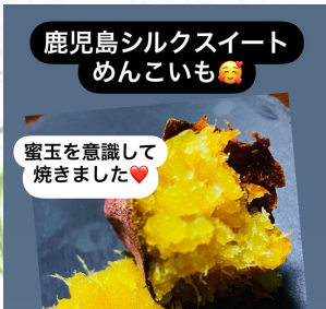
鹿児島シルクスイート めんこいも