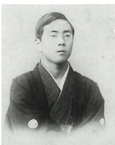
佐々木 喜善（ささき きぜん）

明治19年（1886）、現在の岩手県遠野市土淵町に生まれる。遠野の伝承を柳田國男に語り『遠野物語』の成立に深く関与した。また、オシラサマやザシキワラシの研究、昔話の収集を行うなど、日本における昔話の先駆的な研究を行ったことでも知られる。