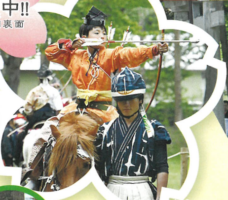
こども流鏑馬大会 12:30~13:30